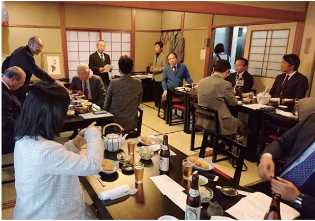
割烹喜久水にて 山口会長挨拶