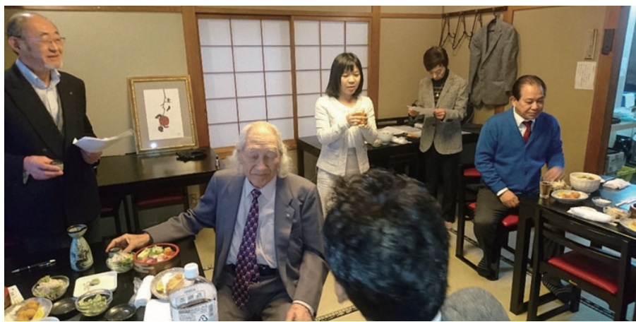
今年の最終例会に乾杯